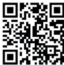
Les secrets de Champagne